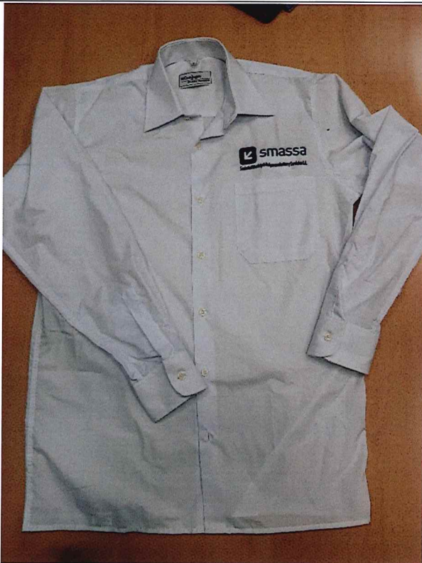
3.- Camisa manga larga